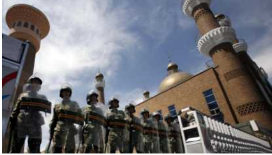
الشرطة شبه العسكرية في أروموتشي، تركستان الشرقية، يوليو 2009

بقلم / نوري توركل وبيث فان شاك، 16 يوليو 2021