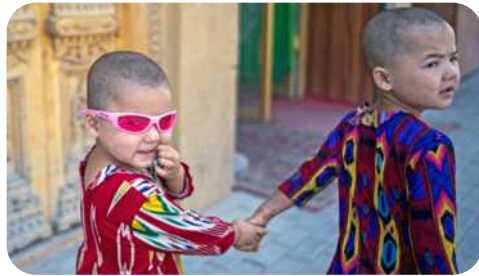
طفلان أويغور يسيران في شارع في محافظة ياركند، لولايت كاشغر، في تركستان الشرقية شمال غرب الصين، 24 يونيو، 2017.

دولز، كل بضعة أيام عندما نصل إلى مخيمنا، غالباً ما نتحدث عما نريد التركيز عليه. شعرنا أننا يجب أن نركز على المثقفين الأويغور الذين اختفوا، لأن أحد الأشخاص اتصل بابني مؤخراً