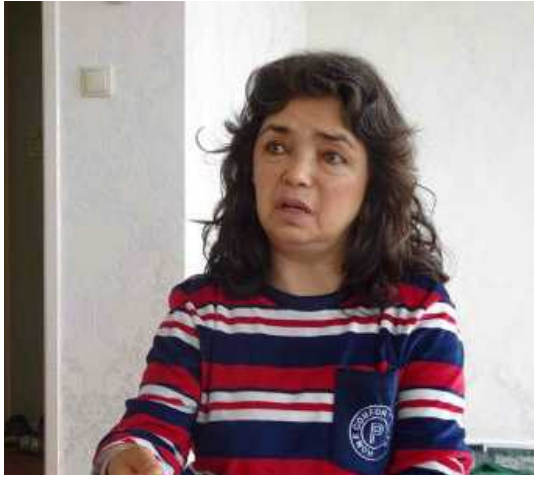
قلب النور صديق