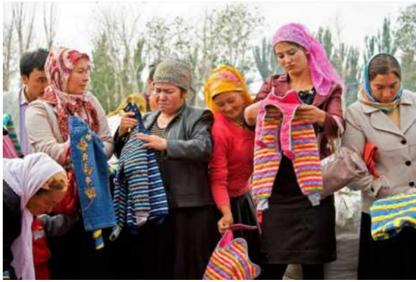
نساء أويغور يشتري ملابس أطفال في أحد الأسواق بتركستان الشرقية.

عندما تحتاج الشركات الصينية إلى موظفين، فإنها تلجأ عادةً إلى شركات الموارد البشرية، التي تنشر الوظائف الشاغرة لعمالها على مواقع التوظيف، مثل Liepin.com و job.com51.